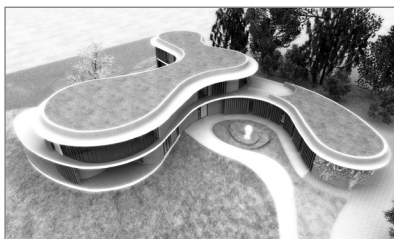
Slika 1: Vitalna hiša – ptičja perspektiva (ilustracija: David Hosta)

Na splošno lahko rečemo, da se uporabe principov feng šuja v projektu praviloma ne vidi na prvi pogled. Če gre seveda za praksa ali projektanta feng šuja, ki ne uporablja kitajskih simbolov (na primer vetrnih zvončkov, tradicionalnih kitajskih kipov ali drugega okrasja). S kitajskimi simboli ni nič narobe, če so vključeni v celovit koncept, niso pa nujno potrebni za dober feng šuj prostora. Enako učinkoviti so lahko