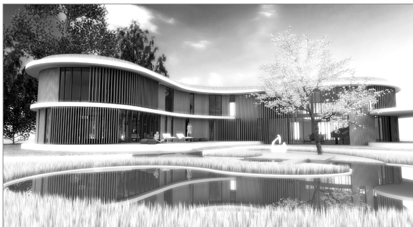
Slika 2: Vitalna hiša – vrtno pročelje (ilustracija: David Hosta)

Primer arhitekture, ki uteleša princip mehkega gibanja življenjske energije qi , je konceptualni projekt Vitalna hiša [1] . Ta je zasnovana tako, da je njena osnovna geometrija v celoti sestavljena iz krivulj in ravnih črt, praviloma brez pravih kotov. Na ta način je mogoče oblikovati v vseh merilih, tako enoprostorne razstavne paviljone kot velike poslovne stavbe. Prav tako ni omejitve v višini. Zgradbe so lahko pritlične ali večetažne. Poleg geometrije, ki upošteva gibanje življenjske sile qi , je pri vitalni hiši poudarjen tudi pojem vitalnosti, živosti. Hiša je obravnavana kot živ,